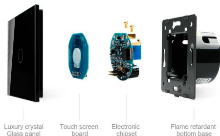
Luxury crystal Glass panel | Touch screen board | Electronic chipset | Flame retardant bottom base

Perceive the essence through the appearance