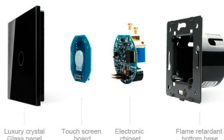
Luxury crystal Glass panel | Touch screen board | Electronic chipset | Flame retardant bottom base

Perceive the essence through the appearance