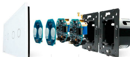
Luxury crystal Glass panel Touch screen board Electronic chipset Flame retardant bottom base

Perceive the essence through the appearance