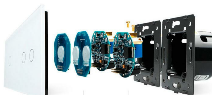
Luxury crystal Glass panel Touch screen board Electronic chipset Flame retardant bottom base

Perceive the essence through the appearance