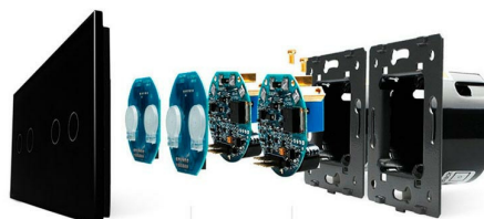
Luxury crystal Glass panel

Perceive the essence through the appearance