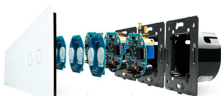
Luxury crystal Glass panel

Perceive the essence through the appearance