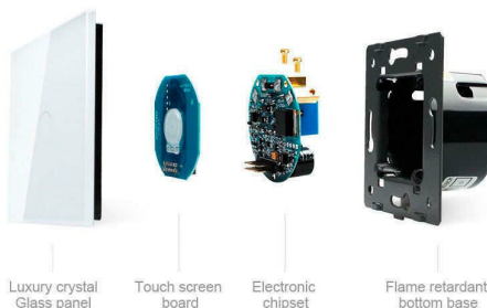
Luxury crystal Glass panel | Touch screen board | Electronic chipset | Flame retardant bottom base

Perceiva the essence through the appearance