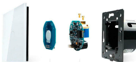
Luxury crystal Glass panel | Touch screen board | Electronic chipset | Flame retardant bottom base

Perceiva the essence through the appearance