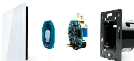
Luxury crystal Glass panel Touch screen board Electronic chipset Flame retardant bottom base

Perceiva the essence through the appearance