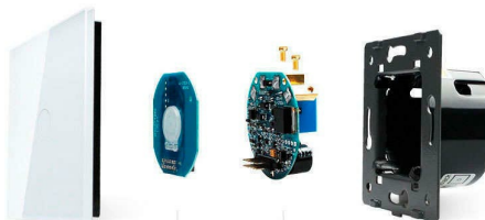
Luxury crystal Glass panel | Touch screen board | Electronic chipset | Flame retardant bottom base

Perceiva the essence through the appearance