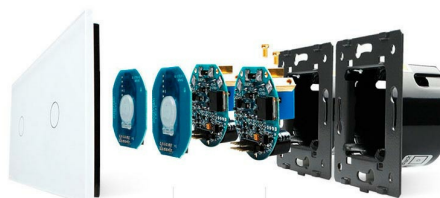
Luxury crystal Glass panel Touch screen board Electronic chipset Flame retardant bottom base

Perceive the essence through the appearance