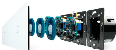
Luxury crystal Glass panel

Perceive the essence through the appearance