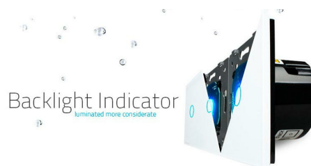
Flame retardant bottom base